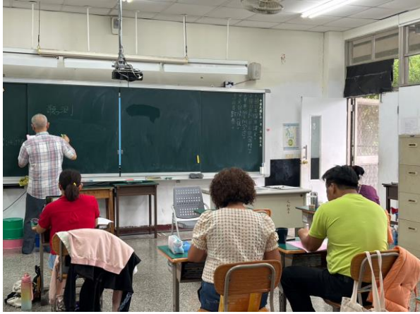
族語研習 A 班-爸媽一起學習自己的語言