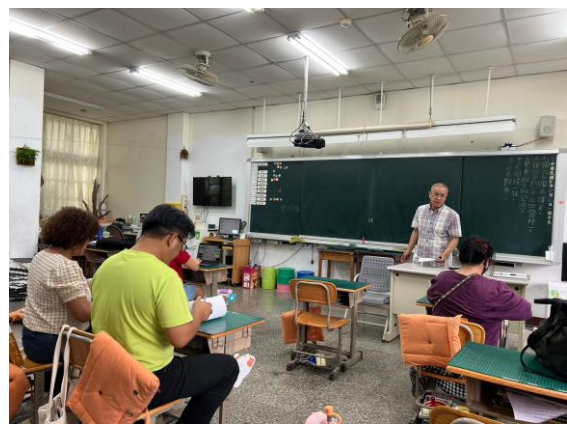
族語研習 B 班-爸媽一起學習自己的語言