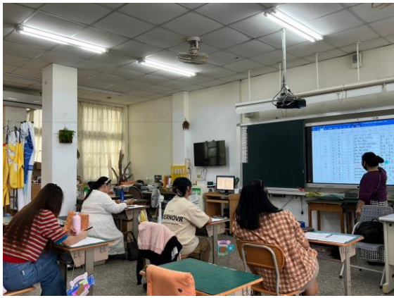
族語研習 B 班-爸媽一起學習自己的語言