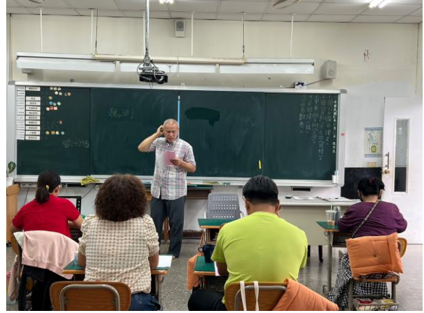
族語研習 A 班-爸媽一起學習自己的語言