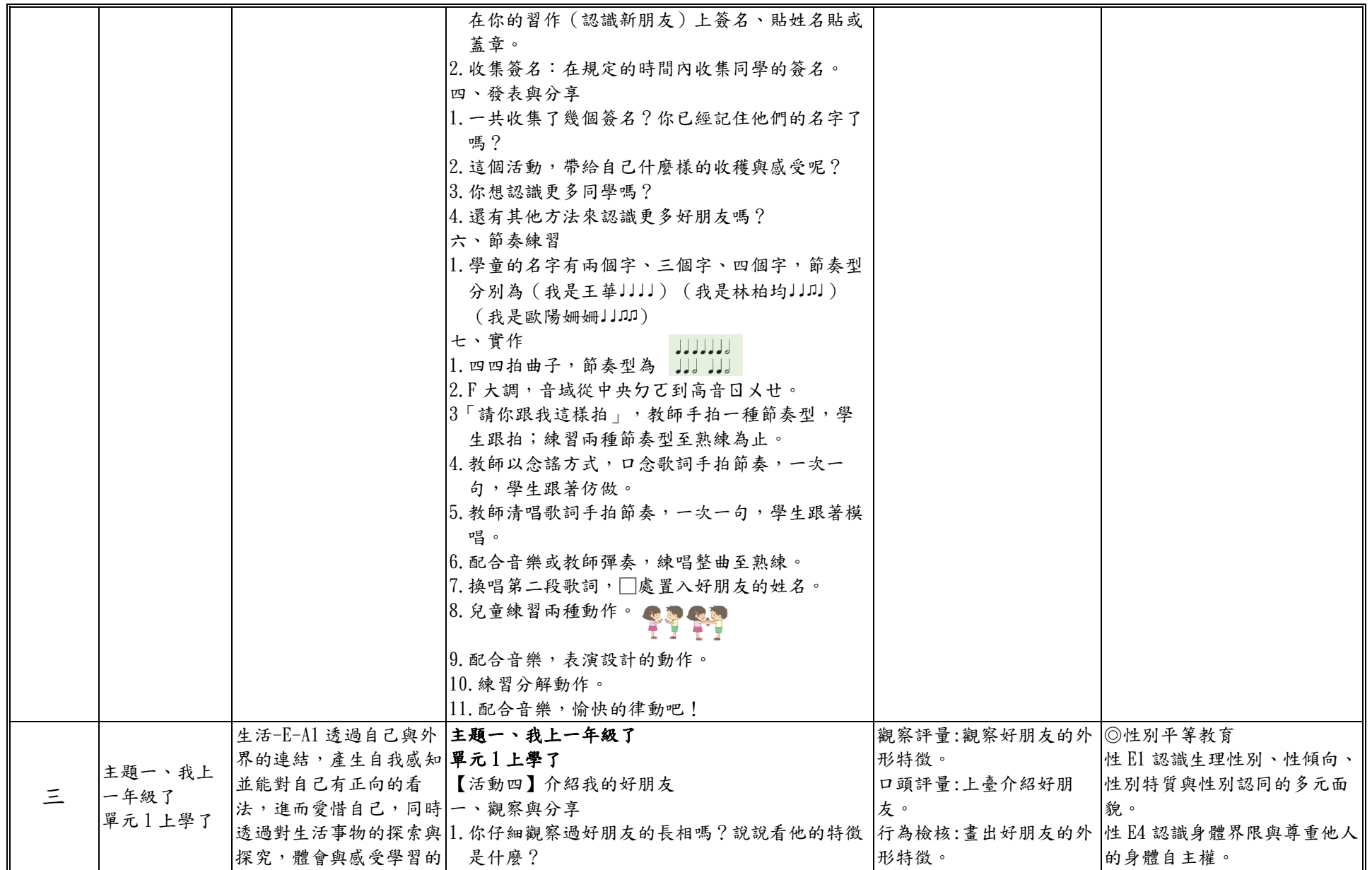
附件 2-5 (一至四／七至九年級適用)