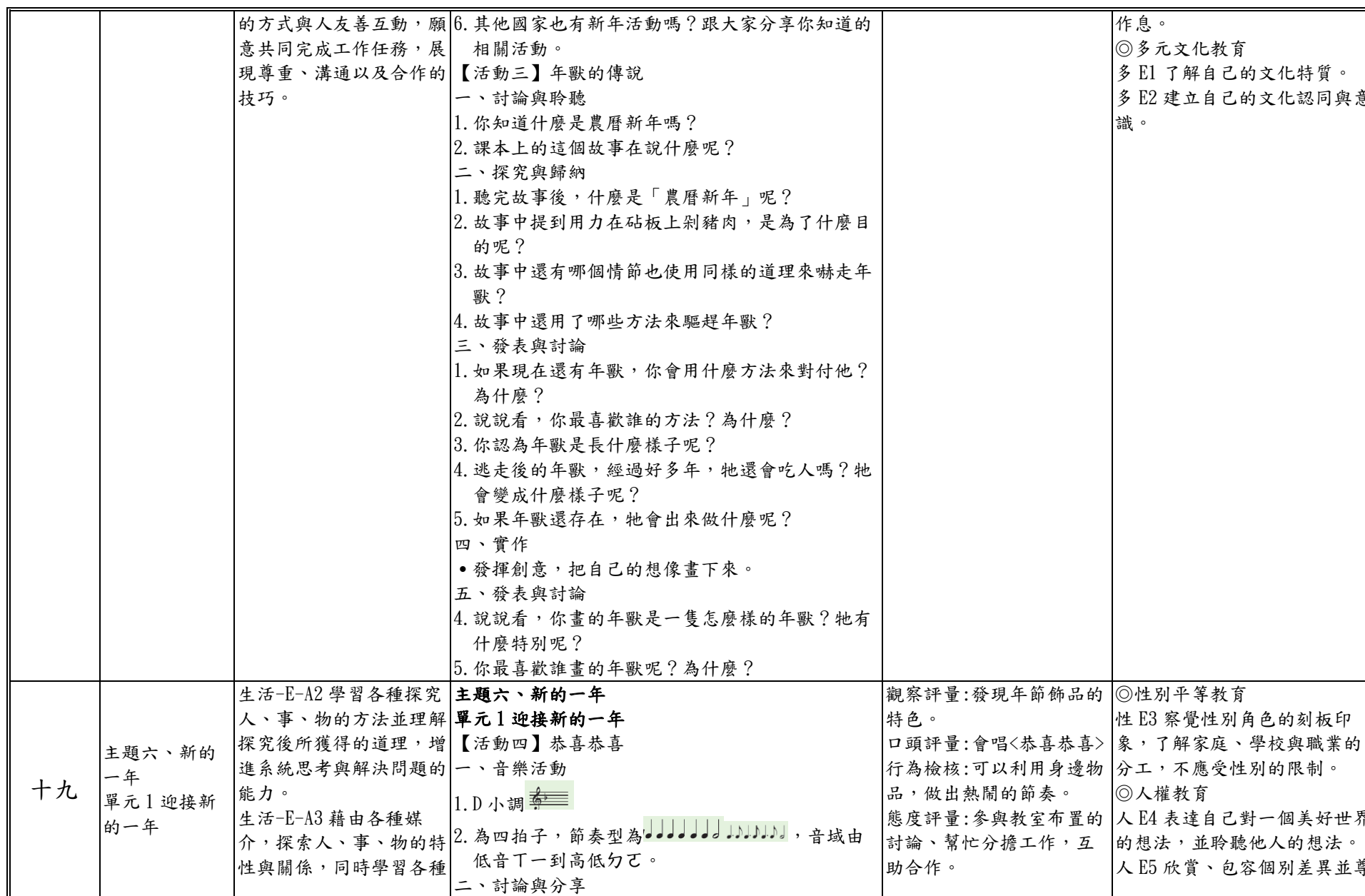
附件 2-5 (一至四／七至九年級適用)