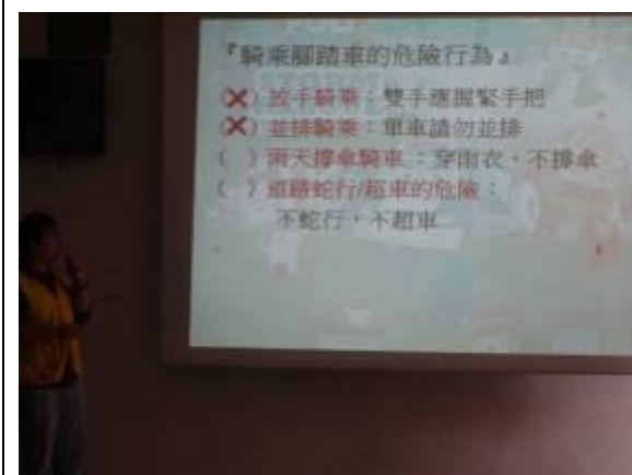
說明：騎乘自行車之危險行為