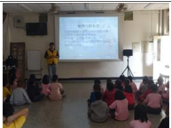
說明：發生交通事故的後果