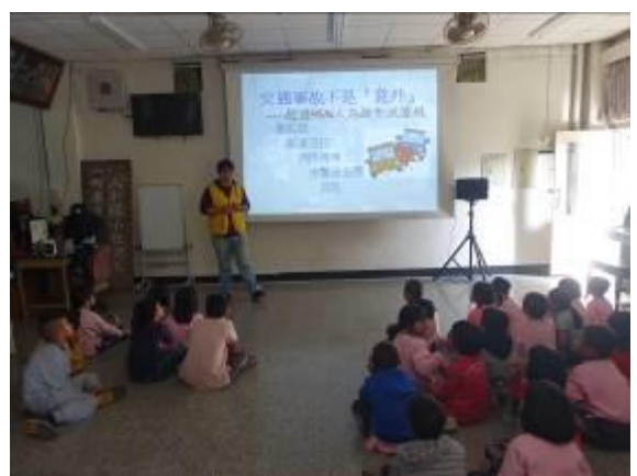
說明：騎自行車之交通規則