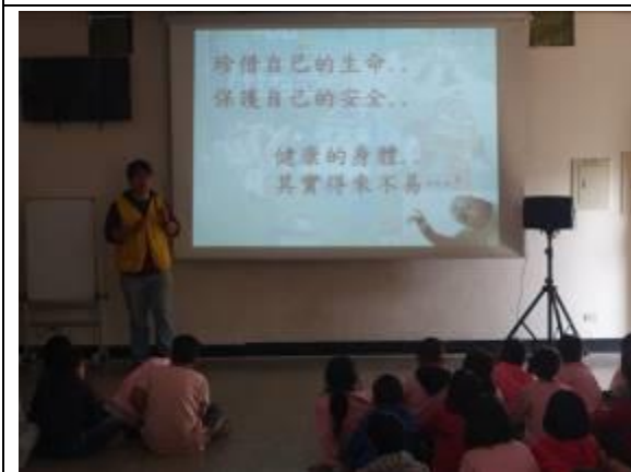
說明：珍惜生命注意交通安全