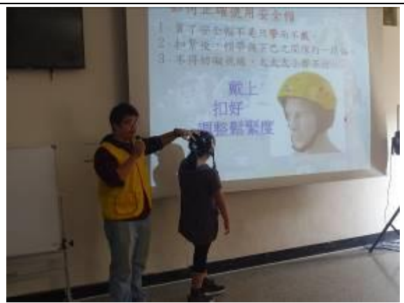
說明：騎乘自行車要戴好安全帽