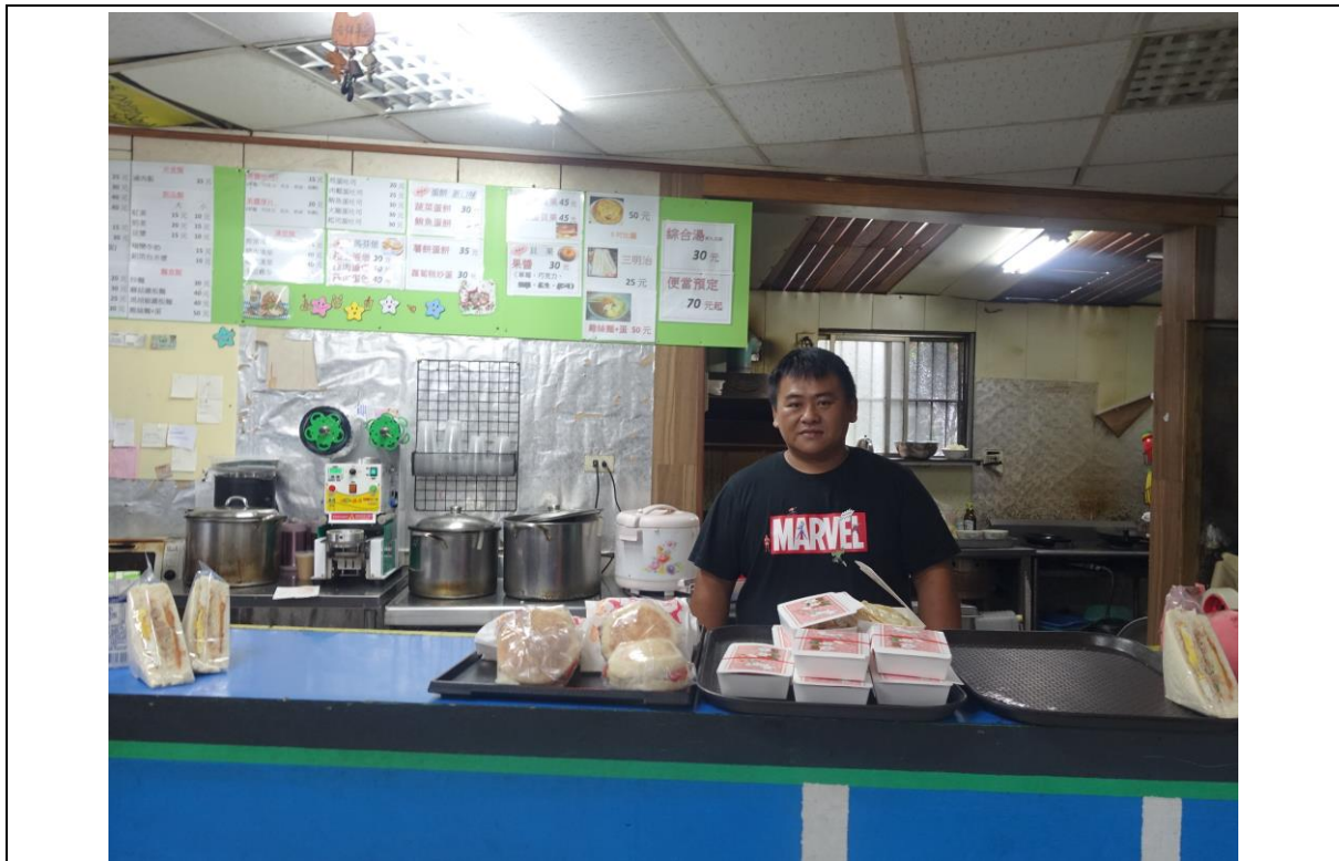
地點：南投縣 信義鄉 人和村 2 鄰民生巷 30 號 簡要說明：商店內部